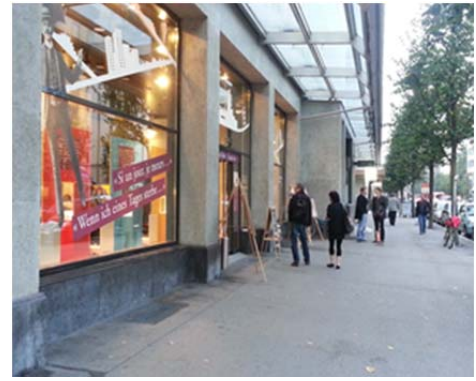
Reflets de la semaine de Palliative-Fribourg/Freiburg du 1 er au 5 octobre 2013

"Un succès!" c'est ainsi que l'on peut qualifier la Semaine organisée début octobre 2013 par notre section. En effet, l'affluence lors des différentes tables-rondes, conférences et activités culturelles a dépassé largement toutes les attentes. Et pourtant le défi n'était pas gagné d'avance car la concentration de tant de manifestations traitant de la fin de vie sous différents angles aurait pu décourager le public. Mais, pour moi, plus que le nombre impressionnant de participants, c'est la qualité des débats et des témoignages qui était impressionnante.