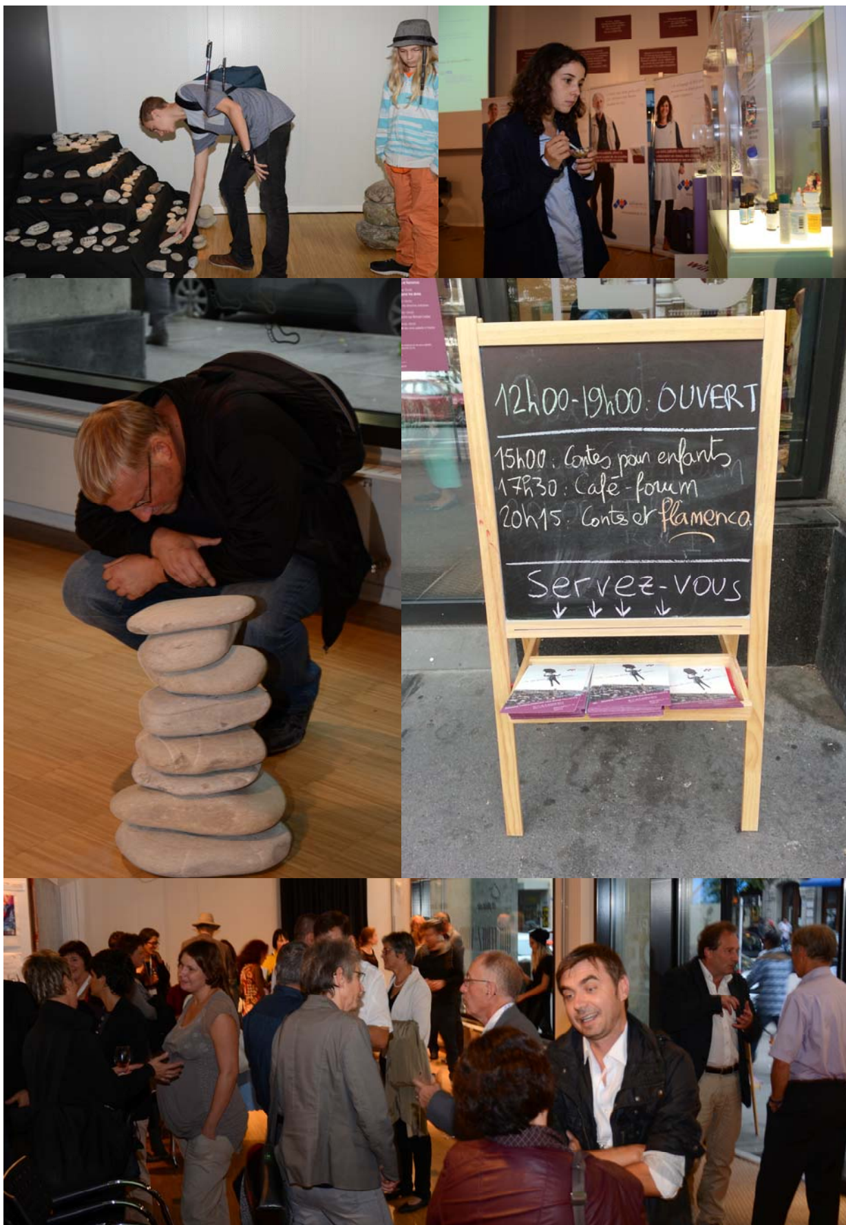
Fotos der Woche der Palliative Fribourg/Freiburg vom 1. bis zum 5. Oktober 2013