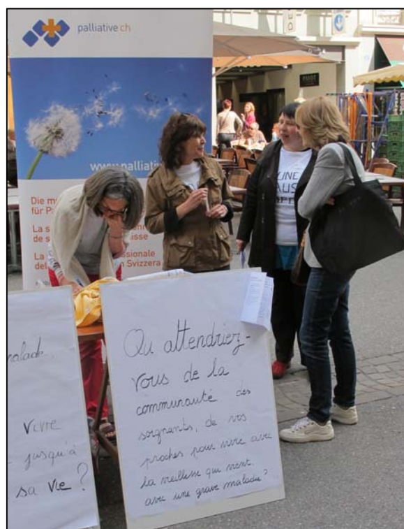
Marché de Fribourg, été 2013

Les personnes qui parlent d'Exit ont pour la plupart vu souffrir un de leurs proches, abandonné à sa triste situation, en attente de la mort. « Je veux qu'on me pique, comme les animaux. C'est inhumain de laisser souffrir un être vivant » me dit une dame. Elle se souvient de la lente agonie de sa sœur, avec des souffrances physiques et morales. Elle parle d'absence de communication entre elle, sa famille et les partenaires de la santé.