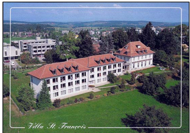
Villa St-François Vue aérienne de la Villa St-François

l'égide de l'HFR. Toutefois, en complément aux possibilités offertes par l'hôpital public, il est prévu de créer une fondation de soutien au centre de soins palliatifs, destinée à lever des fonds pour des projets spécifiques.