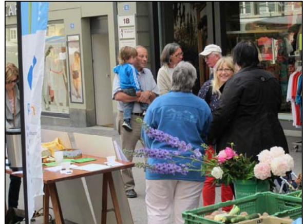
Marché de Fribourg, été 2013

également. De moment en moment, je veux guider les soignants vers ce qui est important pour moi. »